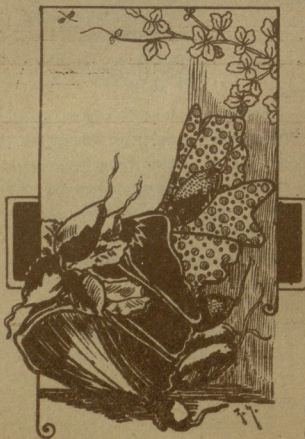
ვისარულებთ თხოვნას და გვზავნება ზუკუს ახალი „ფისანის“, „შლაპა“ — „მუხა“ რედაქციით.