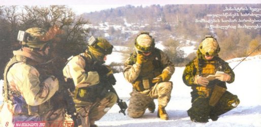
„მინისტრის ხელის“ ირავი სწინებს საბრძოლო მომზადების სიომარ პირობებთან მაქსიმალურად მიახლოებას