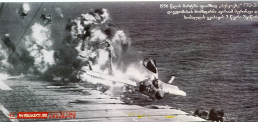
1956 წლის მარტში ავიამხილ „სენკოტეი“ F7U-3-ს დაჯდომისას მომხდარმა ავიარამ მფრინავი და ხომალდის ეკიპაჟის 3 წევრი შეიწირა

ძირითადი შეიარაღების სახით „ჯეგროსანს“ ოთხი 20 მმ-იანი ქვეშეტი ჰქონდა, ხოლო ფიუნელავის ქვეშ, გასამლულ კასეტაში, 70 მმ-იანი 32 უმართავი რაკეტა ითვლებოდა. მათი გამოყენება როგორც მსხვილი სასაერი საინსტრუმენტის (როგორც ბომბდამსწრეა), ასევე სახმელეთო ობიექტების გასანადგურებლად შეიძლებოდა. „საერი-საერი“ კლასის შეიარაღებიდან ფიუნელავის ბორტებზე