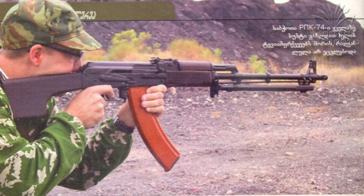
საბჭოთა PPK-74-ი ვეღლასზე სუსტი ვარსკვლავი ხელის ტყვიამფრქვევებს შორის, რასაც ალულა არ ეცდებოდა

თუმცა, ახალი „ნეგევისთვის“ კალიბრის შეცვლა შემთხვევით არ მომხდარა, მსოფლიო საბარადო სამყაროში შეინიშნება უკუტრენდინგია, როდესაც ძირითადი საბრძოლო შეიარაღების კალიბრი იხვე ძველ 7,62 მმ-ს უბრუნდება, რომელიც გასული საუკუნის 60-70-იან წლებში NATO-ს ქვეყნებში 5,56, ხოლო ვარშავის პაქტის სახელმწიფოებში კი 5,45 მმ კალიბრის ვა-