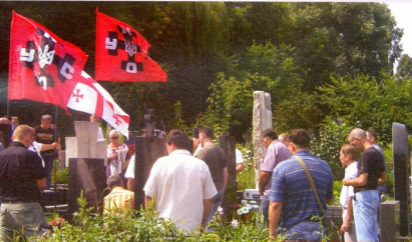
1993 წლის 19 ევლისს სოფელ შრომასთან ბრძოლაში მონაწილეობას უკრაინელი მოხალისეები ქართველებთან ერთად ბრძოლაში დაღუპულ თანამებრძოლითა ხელფეკების მონახულებით აღნიშნავენ

ეს რატრული მოვალობის გრძობას უმზაფრებდა მათ ყველა ცდლობდა დაღუპული თანამებრძოლისთვის მიეყო პატრეი. ეტბო ტრადიში მფეკქინდა და პარაკლისის დროს მის ვარშეპო ვიდქიოთ მას ვეშვიდობებოდი, სამარტუს ვიზრითიოთ ვასაფლავებოდი, მის ხსენს ზალით ვეზმანეპობოდი და მდილიოთი, მდილიოთი ბედთან შესახვედრად, თვალბში ვუყურებოდი მას და არავის ზურგს უკან არ ვიძალებოდი.