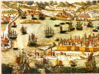
შუა საუკუნეების კადისის პორტი

ჰოვარდს გამარჯვების იმედი აქ-ქონდა, რადგან მეგრძობების უმე-ტესობა ტოფმა იმსხურადა. მან გა-