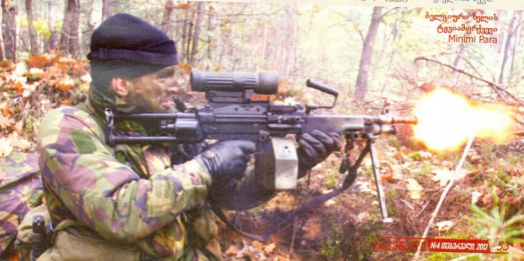
ბელგური ხელის ტვეიამფრტვეი Minimi Para

ერთი შეხედვით, 5,56 მმ კალიბრის ვაზნები ძალიან მოსახერხებელი გახლდათ მებრძოლებისთვის (როგორც ისრაელის, ისე ქართული არმიისთვის), რადგან ამ კალიბრის ვაზნების გამოყენება შეიძლება როგორც „ნგვესში“, ისე ამერიკულ ავტომატურ კარაბინ M4-ებში, რომლებიც საქართველოსა და ისრაელშიც ძირითადი სამხრეთ ავტომატური ცეცხლსასროლი იარაღია („ეხალისში“ M4-ების გარდა, ამავე კალიბრზე გათვლილი „გალილები“ და „ტაფორებიც“ აქვს). მებრძოლებს შეუძლიათ ერთმანეთისთვის მიეცათ ვაზნები, რასაც ბრძოლაში ხშირად გადამწყვეტი მნიშვნელობა აქვს.