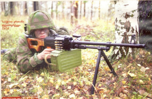
საბჭოთა ერთიანი ტყვიამფრქვევი PKM

ბი“ ბელგური „მინი-მიმისა“ თუ საბჭოთა PPK-ის ხელის ტყვიამფრქვევებს კლასში გადიოდა. ახალი „ნეგევისთვის“ კალიბრის 7,62 მმ-მდე გაზრდის მიუხედავად, თვისი გაბარტებითა და მასით იგი მაინც რჩება ხელის ტყვიამფრქვევების კლასში, თუმცა საცდელზე შესაძლებლობებით გაუსწორდა ერთიან ტყვიამფრქვევებს, საბჭოთა PKM-სა და ამერიკულ M60-ს.