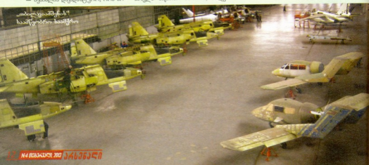
„თბილგეამშქინის“ სააქტირობო სააქტირო