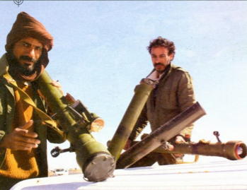
ენ ივის, რუსეთის მიერ ოს და აფხაზ სეპარატისტებისთვის მალულად გადაცემული „სტრელბი“ შემდგომში რომელი საერთაშორისო ტერორისტული დაჯგუფებების შეიარაღებაში აღმოჩნდა...

რომელ ქვეყანას რა ტიპის და რა რაოდენობის გადასატანი საზენიტო-სარაკეტო კომპლექსები მიჰყავდა.