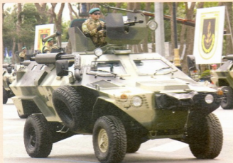
აზერბაიჯანი ჯავშანტექნიკომპლი Cobra-ს დამატებითი პარტიების აპირებს