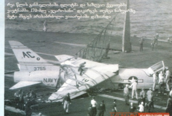
რვა წლის განმავლობაში ფლოტს და საზღვაო ქვეითებმა ვიეტნამში 170-მდე „ჯეჯროსანი“ დაკარგეს. თუმცა ნახევარზე მეტი მსგავსი არასაბრძოლო ვითარებაში დაზიანდა