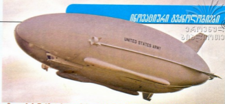
გამოდების წარმატებით დასრულების შემთხვევაში, 2013 წლის დასაწყისში HAV-304-ს ავღანეთში, რეალურ საბრძოლო პირობებში სამოქმედოდ გაუშვებენ

ღირებულების შეჭმნის ზელმეტრულებას ზელი 2010 წლის ოქტომბერში მოქურა და გვგმით 2012 წლის თებერვალში საგამოდლო პროგრამით