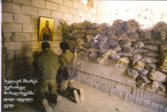
სულიერ მხარეს უკრანელ მოხალისეებში დიდი ადგილი ეკავა