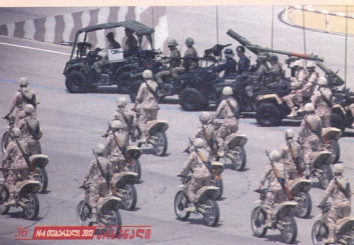
ირანის არმიის მოტოციკლისტ- კოდროციკლისტთა ქვედანაყოფი

შეეკამში მალეულად ნაყიდი ხუთი R71-ის საფურცელზე საშუთა ანალიო- ვი დამზადდა და 1941 წლის გზაფე-