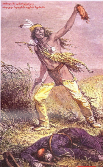
ბრძოლაში გამარჯვებული ინდიელი სკალპის აღებას ზეიმობს

ინდიელთა შორის სკალპის მოხსნას თვდაპირველად რელიგიური დატვირ-