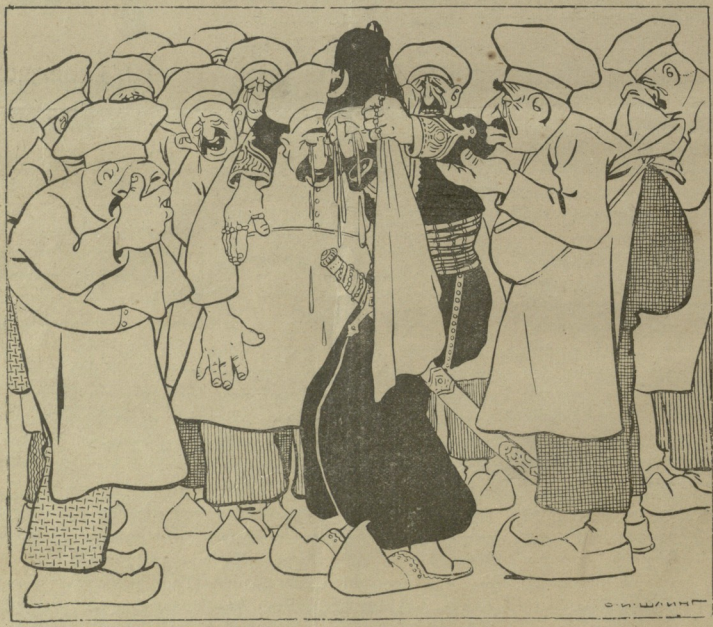
დარღნელი დაკეტეთ, შემოგვაკლდა სურსათი.

უდროთ გარდაცვალებას, რომლის დაკრძალვა დანიშნულია კვირას 15 მარტს. განსვენებული სულის მოსახსენებლათ პანაშვილს გადიხდიან თხელიძის სასაძილოში ყოველ საღამომობით. ახლ თ მოსული.