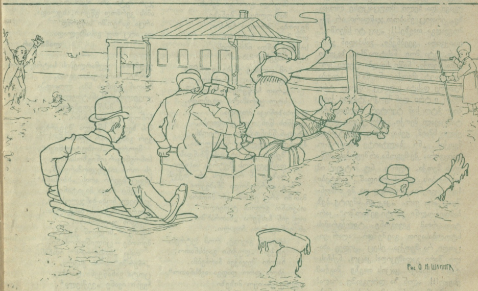
ჩეხ. ი. შ. შაინი

ადრესი: თიფლისი, ტიპოგრაფია შრომა, თეოფილუ ბოლკვადზე.