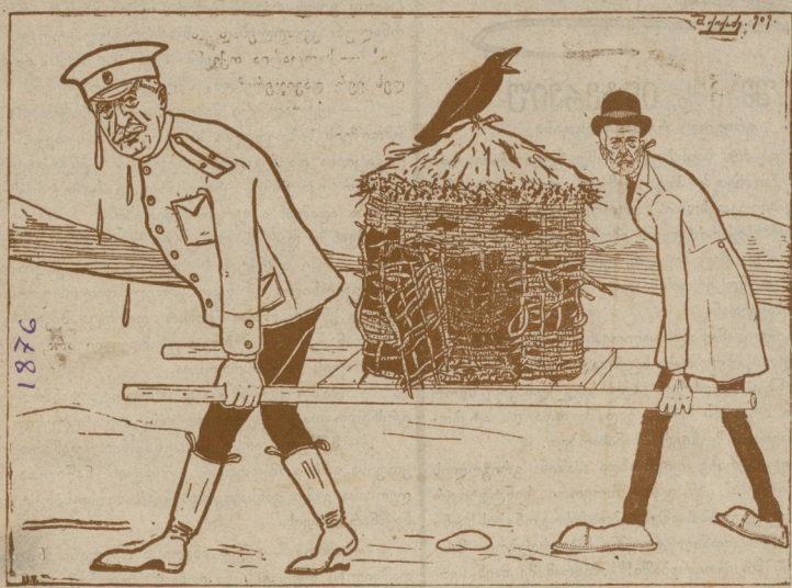
ოზურგეთის მომავალი რეალური გემნაზია.

ბებურიშვილი ბებური ოფლისგან დაიწურება, რეალურ გემნაზიისთვის თავი არ დაეშურება! პლატონი, (ვიცე ვალავა) წელში მოხრილი რკალათა მისდევს ვალავას და მოაქვთ „ჰიგიენური“ კალითა. საგიმნაზიო შენობას თვალი ვერ ნახავს ამგვარსა, თანაბრათ შეეფერება კარგ ამინდს, სისტიკ ავდარსა. ბჰე განიერი, ნათელი, ქარბუქის გამატარები,