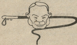
ფრთხე დაჭრილი შევარდენი.

იალტა. მაძებარმა პოლიციამ ერთი აღვილობრივი თათარი ცნობილ დუბროვინს მიახვავსა და დააპატიმრა. მიღებული ზომების შემდეგ თათარი გამოტყდა რომ ის მართლა დუბროვინია და განთავისუფლეს.