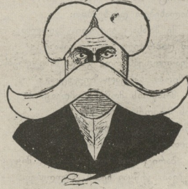
ნიავე და ნაკადული.

ველსა ეწვია ნიავე, ბალახზე შორის იარა, მოსწყინდა.. ბაღში შეკურდა, ვარდს აუშალა იარა