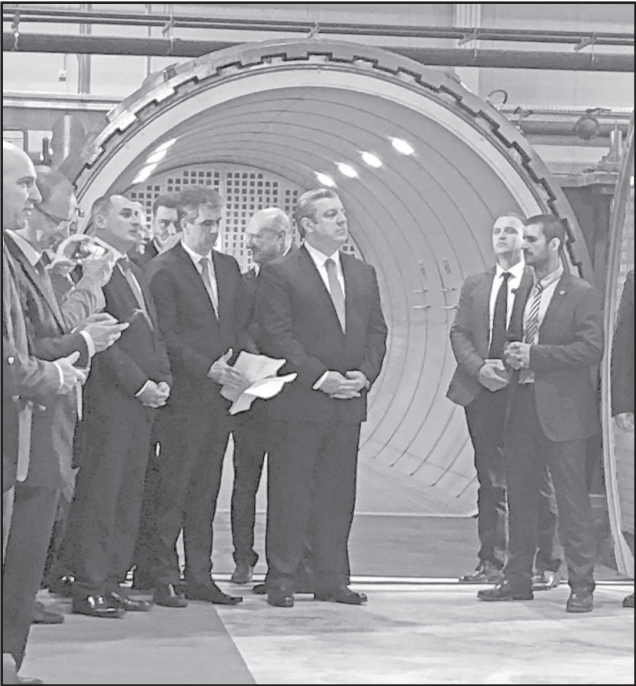
საპარტიველოში გუშინ ამერიკა-საქართველოს პირველი თვითმფრინავის კომპოზიტური ნაწილების მწარმოებელი ქარხანა ATC (Aero-Structure Technologies Cyclone) გახსნის. ქარხნის გახსნის ოფიციალური ცერემონიალს საქართველოს მთავრობის, პარლამენტის, ადგილობრივი ხელისუფლების, დიპლომატიური კორპუსისა და ბიზნესრეგისტრაციის, ასევე, ისრაელის მთავრობის წარმომადგენლები ესწრებოდნენ.