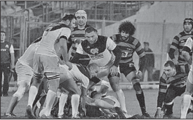
საძარტველს მორაგებითა ეროვნული ჩემპიონატი დასასრულს მიუახლოვდა — დარჩა მხოლოდ 14 ნოემბერს გასამართავი ფინალური მატჩი. იმ კი, შარხანდელივით, „ლელო“ და „ლოკომოტივი“ დაუპირისპირდებიან ერთმანეთს. ეს უფლება მათ ფაქტობრივად