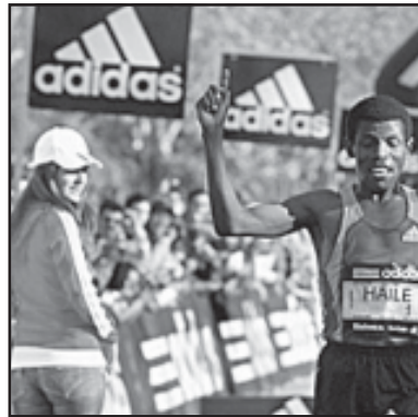
ბილში, 20 და 10 კმ-ზე სიკრიკში გზატკეცილზე, საბათობრივი სიკრიკში, 2008 წლის 28 სექტემბერს კი მსოფლიო რეკორდი დაამყარა გებრესელასიემ მარტინოვიჩის (42,195 კმ). 1995 და 1996 წლებში ის ალიარეს საუკეთესო მძღვანელად მსოფლიოში.

გებრესელასიემ ორჯერ გაიმარჯვა ოლიმპიურ თამაშებზე (1996 წ. — ატლანტაში, 2000 წელი — სიდნეიში, 4-ჯერ კი მსოფლიო ჩემპიონატებზე 10 კმ. სიკრიკში). ათენის თამაშების შემდეგ, სადაც ის წარუმატებლად გამოვიდა, გადააქრო უფრო დიდ მანძილზე სიკრიკში. ის რეკორდსმენი 20 კმ. სიკრიკში.