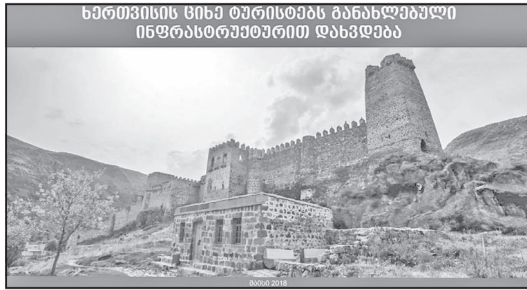
ხართვისის სიხე თურისტებს განახლებული ინფრასტრუქტურით დახვდება