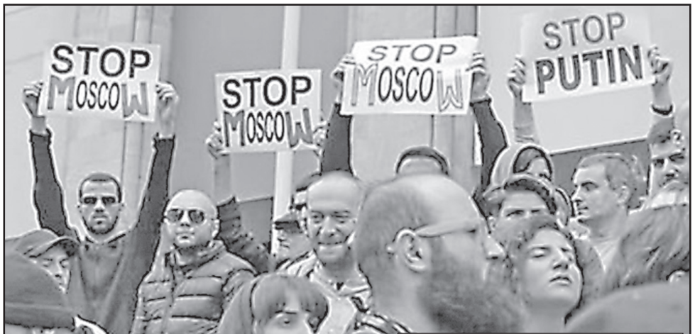
ყველა-ყველა და, პარტიკლი ნარკომანები ამ სანყალ კუბინს რაზს პრჩინა?

თანამედროვე ეპოქაში ნარკოტიკი გულისხმობს იმ ნივთიერებებს, რომლებსაც ადამიანები იღებენ არასამკურნალო მიზნით – დარდის გასაქარებლად, განწყობის ასამაღლებლად, სიამოვნების მისაღებად.