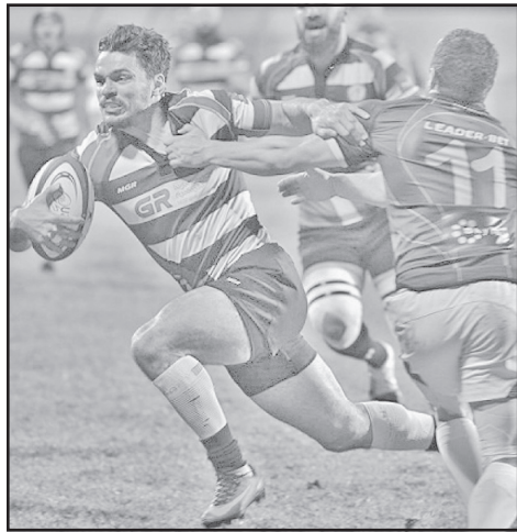
თბილისის „ლოკომოტივმა“ ქუთაისის „აია“ დიდი 10-ის ფინალში 29:10 დაამარცხა...