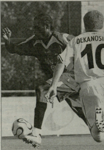
ჩასვლი იმვე სიონში ითამაშებს