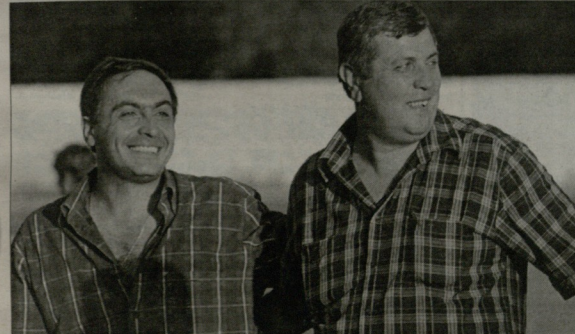
მესხეთის პრეზიდენტი გია მესხელი და მთავარი მწირთელი კობა თვდიამიძელი