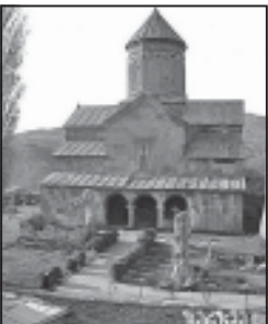
ყოვლადძებული მოციქული მათე

27 ნოემბერს, სწორედ შობის მარცხის დღეს, საქართველოს მართლმადიდებელი სამართავლი მადია იხარება მოციქულ ფილიპოს.