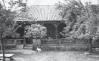
მინაპარტა სახლი არგვეთში