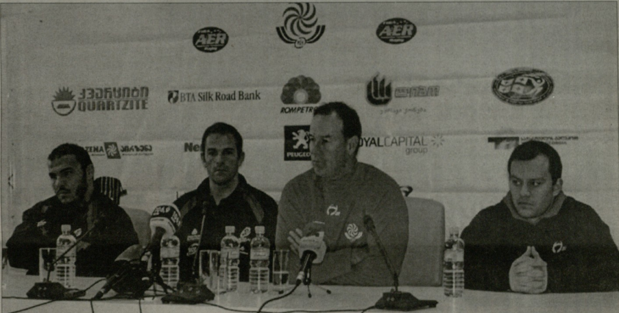
გუნდის მწვრთნელი პორტუგალიის ნაკრებიდან ტიმ ლინი, მარჯვნივ, საქართველოს ნაკრების მწვრთნელი ტიმ ლინი, მარჯვნივ