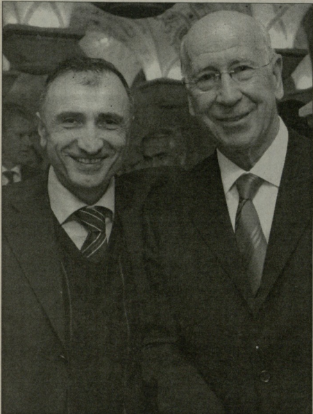
მამუკა კვარაცხელია და ბობი ჩარლტონი