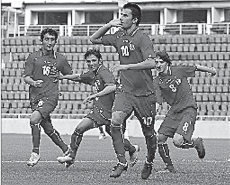
17-წლიანი ნაკრების მეთვლიყველი ვი-ნაყარია დასაჯეს უხეშობა აღამიანია.