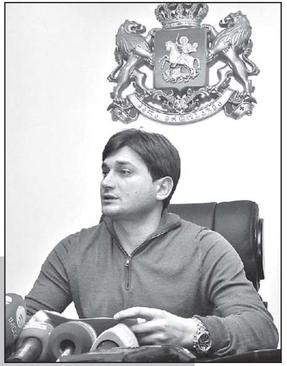
ფირსა ქამრთვლის გაგონე-ბაზე

„უკ, შინი გულისა, - გახა-რებულმა ლუწარსაბრით წამო-ვიკახეთათქამის თანაქმე-ლი ამჟამინდელი წინასწარ მი-ნისტრის ამ სიტყვების გაგონე-ბაზე, იქნებ ახლა მინც გავგე-“