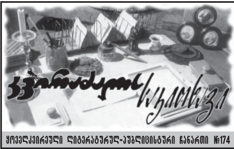
ყოველკვირეული ლიტერატურულ-კულტურული ჩანაწერი №174