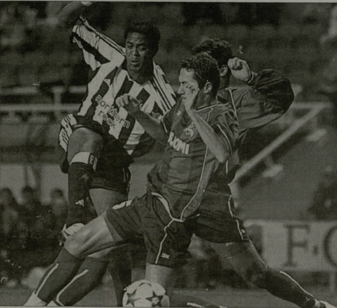
გაგუჩაძის განგერნილი დინამო უფას თასის ჯგუფურ ტახტზე ნოვოსადს მუხევა

ოთხეუ მატჩი ნადავთ რატომ მოხდა ასე? რა თქმა უნდა, ამასაც თავისი მიზეზები ჰქონდა. კლუბის ბოუგეტში იმ სეზონისთვის ორი მილიონ ლედარი იყო. 1 250 000 დოლარი გუნდს გამოუცვლეს, დანარჩენი 750 ათასი კი გუნდს ფეხბურთელების ტრანსფერებით უნდა მოეპოვებინა. იმდროინდელი ფეხბურთის განვითარებისთვის უნდა მოეპოვებინა შემადგენლობის შერჩევას. ამან ის სიტუაცია დაგვაკარგვინა, რაც აუცილებელი იყო გუნდისთვის. უფას თასის ჯგუფურ ტახტზე გვერი ფეხბურთელი გამოიყვანდა ტრავმის გამო - ვია ნემსაძე, რომელზეც ანტიბიოტი იყო გუნდის თამაშზე, ლეანო სიდაგაძე გუნდს კარგად, ლუბა სალუქიძე, დავით შიშვენიშვილი, დავით კვიციანი - ამ ფეხბურთელების სრულფასოვნად შეცვლა ძალიან ძნელი იყო. ვაბა დვალდი და კახა მახარაძე - მათში მათ არაფერი იცნობდა და ასეთი ფეხბურთელებიც ვთავაზმეთ უფას თასის ჯგუფურ ტახტზე. ბოლი მატჩი "პანინოისთან" 2:5 ნაკლებად და უმცირეს პრესმაც დაინარჩუნა, სადები თამაში იყო. ჩემ მიმართ არაფერი მთავრდება მურგაბეგაშვილი. ასევე მოთქმას და ახლაც გაიმეორებ - თუ ვინმეს რამეში უნდა ვაფერხა, ნამარ ამ მატჩის დიდობანაში. რაც შეეძება ტრეტალი ზაბოტის, არსებობს დამირეზი ღარიანი ფსონიც კი. არც არაფერს უფ-