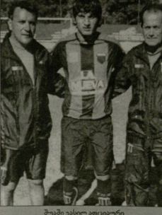
შუბი ვახილ აფციავრი

1990 წელს დაბადებული არუსაგვის "მამულის" ვებტორული ვახილ აფციავრი (მწიფრული მამუა მწიფრული და კახა ბეჟური) ვახილ წლის თებერვლი მსტაფორებაზე ვაგვებ ვაერის არგენტინის წარგნის საფხვრული კლუბის "როსარიო სენტრალის", "სან ლორენსოსა" და "უელს სარსიელის" ყოფილ ვეხვურთობან და ამჟამად ვეწრეწვლას, ვეწარმო გიბოლი დედაცვიოსთან არგენტინაში. დედაცვი, შესაძლებელია მომზადების შემდეგ, ვახილ აფციავრის ურჩია საკონტროლო თამაშებით ნარდგაროვი არგენტინის პრეტორ B დივიზიონში მოასპარეზე "ნუევა ჩიკაგოს" საფხვრული გუნდთან, სადაც ვახილმა თავი ვაგამოჩინა. კარგი მომზადებით ვეწდეს ის უკვე დიაცვიც ამ კლუბის ღირსება. ვახილმა თუ ასე ვაგაგაქრული ერთი წლის შემდეგ შეიძლება ვიხილო უფრო ღვირ ვეწვლი. არგენტინულ კლუბში ვადაცვის მომავალ კანდიდატთან საბრძოლო ვაგამდე დედაცვიოსთან 1990 წელს დაბადებულ, აზერბაიჯანელსა სტაფორებაზე მტეტი ვიცი ტრავმული მოიხრება. აგრეთვე, 1990 წელს დაბადებული ვადაცვი ავჯაგინილს, ეს ირთი ვეხვურთობა მამუან ნოემბერში ვაგვებ ვაერის არგენტინაში.