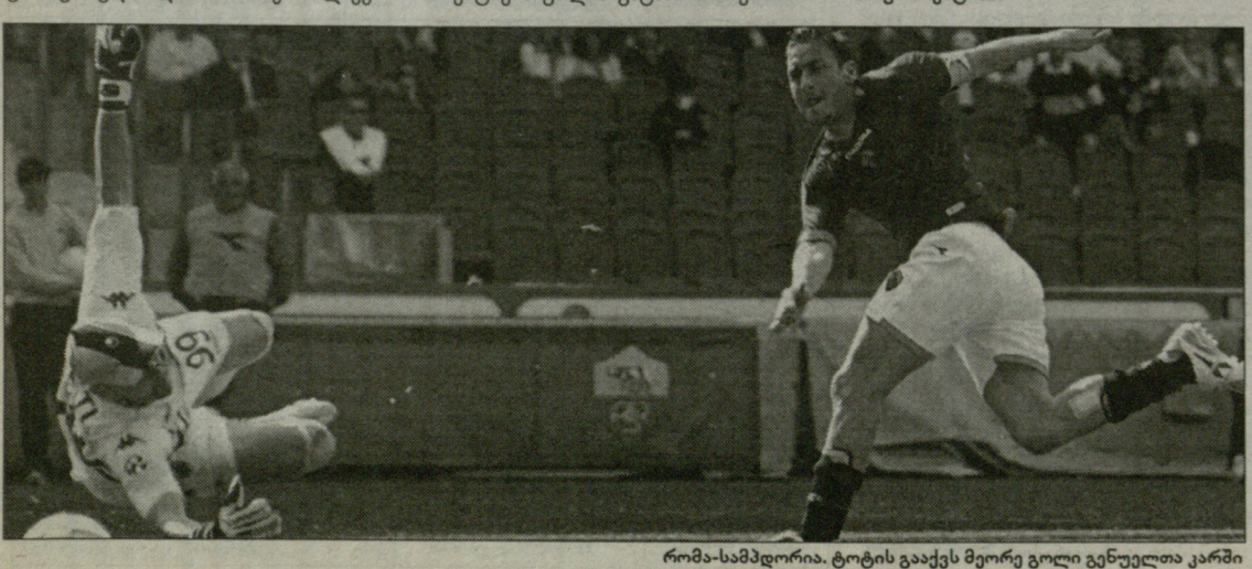
რომა-სამპდორია. ტოტის გაქცევა მეთრეველი გენუელთა კარში