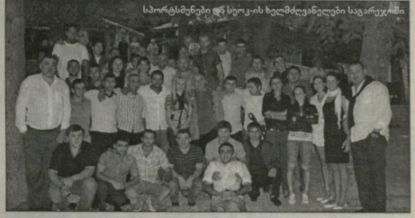
საპროსამინოს წევრები და სერკის ხელმძღვანელები საჯარო პრესკონფერენციაზე