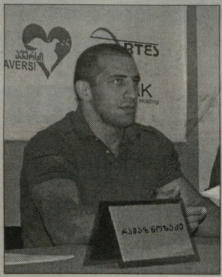
საპროსამინოს კომიტეტი უკვე ნიბოთა, მუშაობს და მის საქმიანობას...