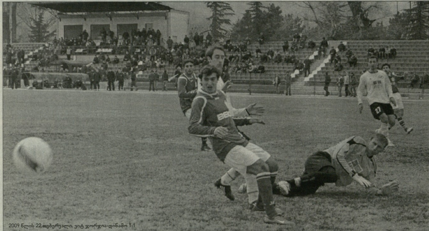
2009 წლის 22 აპრილი. ეთ ჯორჯია-ღინამო 1:1

რამდენად ერთი კვირაც და ურეველად გრილ ზაფხულსაც გადავიცლებით. თუმცა, შემოდგომის დადგომამდე ერთობ „ცხელი დღეები“ გველის - საკარგოდ სარგებებს შთაბრძნის თანამდებობაზე დარჩენა-არდარჩენის თემაზე დარღვევა მოლოდინიდან გამომდინარე. პო, ნამდვილად არ არის პატარა ახალი, ფეხბურთისაშენების მუშაობაზე მჭიდრო კავშირში მყოფი გაცვლითი პოლიტიკის საფარველში უპირისპირებულ საკარგოდ სარგებებს. ფეხბურთის ეფერეზის ხელშეწყობის თემაზე, ეს ცალკე თემაა და უზუსტეს ხანში აუცილებლად შედგურდება. მანამდე კი ერთნელე ჩემპიონატს „მივხედო“, მით უფრო, რომ მეთხუთ ტურში ამ სეზონის პირველი ზეპირციხული დაპირისპირებაა: „ღინამო“-„ეთ ჯორჯია“!