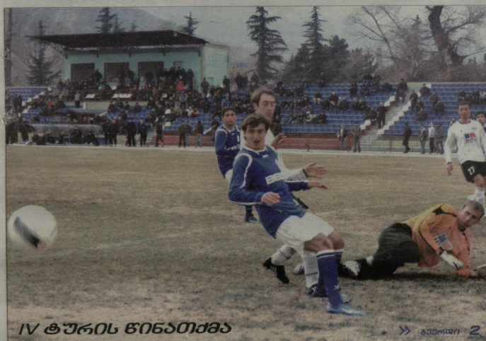
IV ტურის წინათემა >> ბაჟონი 2