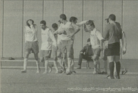
ილაზიკური ექვბეს უსაფუძვლოდ მიიწნეს

ბასსული სეზონის რამდენიმე სავსე მხეველანის შემდეგ ფეხბურთის ფერმარეცა საგანებო კომისია ჩამოვადებო. კომისია მუშაობის შედეგად, ერთობლივად რუსეთის „ოლიმპის“ ხელმძღვანელებს ვაბრძობან.