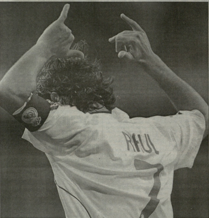
ფორმებული, თუმცა ჩემს მომავალზე 2010 წელს სერიოზულად დაფიქრებ-ბი და გადაწყვეტილებას მივიღებ.

- დამს, ვეფერებ. მე ვიცი, რომ ყოვე-ლი დღის გასულ კარიერის დასასრულ-თან მახალბის. ეს ცხოვრების ბუნებ-რივი კანონია. ერთს და იმავე საქმის მუშაობა ვერ გააკეთებ. სხვა პროფეს-იის ადამიანებისგან განსხვავებით, ჩემს, ფეხბურთელებს ძალიან ადრე გადავარდა შეშინაზე არადა, სხვა პრო-ფესიებში 31 წლის ადამიანი მიშობდება ვერ კიდევ მასობდება და ერთი დღეც არ სქობდება ნამუშევარი. ჩემი აზრით, კიდევ მიშობდე 2-3 წელი დაღ-და. ვერ ვეფერებ და წასვლაზე სერი-ოზულად არ ვფიქრობ. როგორც ვიცი, კონტრაქტი 2012 წლამდე მაქვს გა-თვლილი.