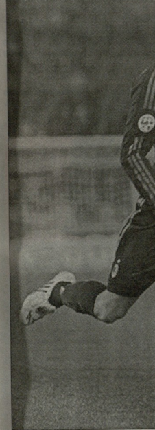
დელი შეტყობის ტრანსფერის გადასვლა ინტერნეტ-საიტზე

არსენალმა მოსლოდნელი იყო, ვერსიულად კლუბებმა ზამთრის სატრანსფერო ფანჯარისას ახალ მოთხოვნებში დიდი ყურადღება დაუბრუნეს. კლუბმა დიდი ყურადღება დაუბრუნა. შეიძლება ვთქვათ, რომ არსენალმა უპრობლემოდ დაამტკიცა საფეხბურთო ასოციაციამ. მიოტი, კონკრეტულად მიყვებით მოვლენებს.