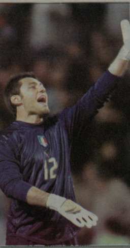
სერია A სოლი ტურნი, „ჯენოა“ „პალდინის“ მინილური ანგარიშით სილი, ტრავადრე და გადაწყვეტი ერთ კ შეხვედრის ბოლო წუთზე გავიდა. გამგებული ბურთი სტუმრებს დიდხანს ამოვიკიბა.“

„ყოველთვის ვამბობდი, რომ ჩემი ოცნება ბრახვის სურვილი გუნდში თამაშია. შეუძრივია პროპორტებს ჩემს სამშობლოს განიჭებო და დღემდე ასეა. აქამდე დუნვა ჩემდამი ინტერესს არ იჩენდა და მეც სეროზულად ვფიქრობდი „აქვრაზე“, მაგრამ ახლა ცველფერი თავის ადგილზე დამდა. დღეს უკვე თამაშად შემიძლია ვთქვა, რომ სელვსაში მოხვედრის რეალური შანსი მაქვს. მოკლედ, არჩევანი გავაკეთე და ამიერიდან მხოლოდ დუნგას ზარს დაუვლეობი.“