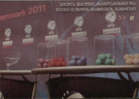
ყველა ზგაუფი, რიგვლამინტი და რყვინი გუნდის მატჩების ბანერიში