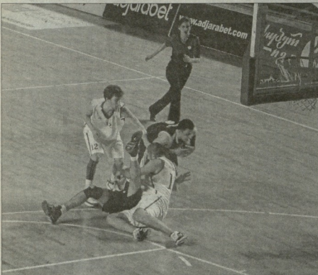
თსუ-სასოფლო ატრის ფოტო