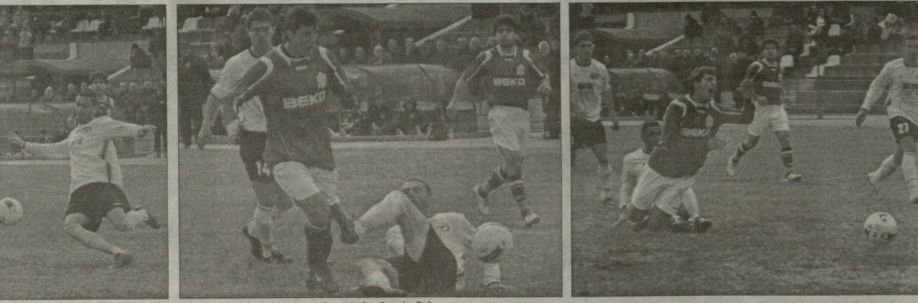
იყო თუ არა თურმეშტტტტტტინა?

მატჩის ბედი მერეპოლს და კაშიას უნდა გადაეწყვიტა. გორიერ მარტყმის დაღვალა ილიანრა, მცვერები ნაწილობა და საკუთარი ვადაცკორიებმა მიიჭორბული ძლიან კაშია გადანიდა - ბეგიაშვილი ლაშის მთელი კარი მოიშველბული ჰქონდა. მუქაძის მცვერი იყო და უნდა დაეგინა უნდაზანად ვერ მოახერხებდა, კვლეშვილი კაშია იყო დამოკიდებული. მაგრამ სირტყერტყვებს ბურთი თითქმის ფტყებში ატყვალდა და ფტტტტტტრად ცირულ გარე ვერ მოხერტყა. ამის მერე ეიტ ჯგერაძის დაცვაში მუქაძის ღარ დაშვება და იქით გაეცა - აღინაშნა! გოლის გასატყვალა ვინტყვითა უპირატესობა მოდის ცენტრში კიდევ უფრო გამოეყვინა - მოიარაბები ჯონიდა მტკიცეს. უცნაური კია აღინაშნა! ხომ მოსამხატველი პირი-ბები ეიტ ჯგერაძის უკუთხის ატყა, არადა, თამაშის ბოლის მუქაძის გუნდი უფრო მხნე გამოიჭერებოდა. ბოლი კორიდი კი ასეთი იყო - მუქაძის მუქაძე ვახალას გეგა ზარტყმა ლიპარაძის მარჯვენა ფლანგზე კომინიციითა, მაგრამ ბურთის ტყინტი კარგად ვერ ამოჭრა და ოგონის მუქაძის გაატყვია ის.