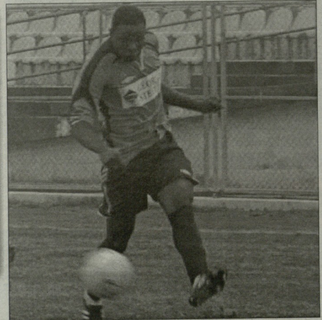
ენწელ კუასაგამ დებოში მიაწყო

10 მეტრეული (19), 11 ბაუნამული (43) სარბაპი კოდალავი - ჟურსაბდანი, ჟორბი, ვახაძე, კობახიძე (43, 56, 57, 58, 59, 60, 61, 62, 63, 64, 65, 66, 67, 68, 69, 70, 71, 72, 73, 74, 75, 76, 77, 78, 79, 80, 81, 82, 83, 84, 85, 86, 87, 88, 89, 90, 91, 92, 93, 94, 95, 96, 97, 98, 99, 100).