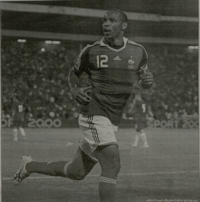
ანრიმ საყვარელის შანსი დაუტოვებელი

საქართველო, ვერ გეტყვით ზუსტად რამდენმა ნაკრებმა მოიპოვა წახელ სამხრეთ აფრიკის საფეხბურთო რაუნდში ამერიკის საკავალთავის მატაჩში გვიან დაბრუნდა დასრულდა. ვერსიები კი არიან საფეხბურთო გუნდების მიერ დაგეგმილი ინტელისუბანი და ესპანელი ნაკრები.