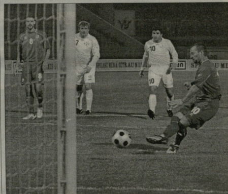
ისლანდელმა ბოლო ვილი უნა-ნაშე ვივინა დასწრესეული.