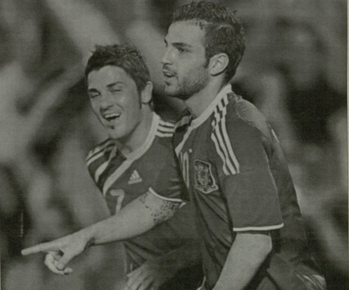
ესპანეთის საფეხბურთო ფეხბურთელი ნიკოლოზი