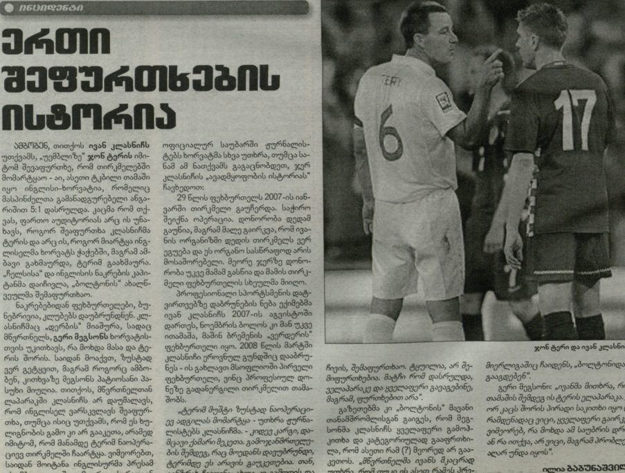
ჯონ ტერი და იგან კლასნიი

იმ განზომილი ელვარდოს გარდა იღდა ზეგუნდელ ვაგაროზს, მაგრამ უფურთე ტელევიზორის და დაწინაურდებით, რომ ეს ფეხბურთის შეხვედრები ნაწილია. ვაგაროზობისა და მსაჯის მოტყუებას შორის ეს ულტეხი განსხვავდება. მისი თიხით ფეხბურთისთვის, რაც ვეგუფც მგეროცქ სავარაზიმობი ხელს ამ რეზულტატში ასეთი ფეხბურთელი, რასკიველია, ვარდელა და მსაჯისადა თირეუმეტიკრიანის დაბნეობის თიხიებს, და კიდეც, გმირს ვადათხებენ თუ სიბუნებრივად, ძალიან არის დაბინკოვებული იმხვე, თუ რომელი ამბავი ხარ. აი, მგავლობა, ინგლისის ნაკრები მსოფლიოს ჩემპიონატზე მოხდა და ნარმოზივიცია, რომელიც ასეთი რაი ფრანკის მილი წინაშე ვაკეთიოს. როგორ ვერინიუსი, ვაგუფიან და დესინა მის ინგლისელები, მსაჯის პენალტის რატიმ ვა მოსტყუებო.