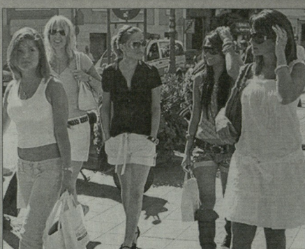
კაპელი ცოტელების მანერა ერთ დღეს გამოკოვს

ნებაშასამირიტი აფრიკაში კარგი მალელები? ამბობენ, რომ დედუღელო დაჯინებია. სან სტიპი გასართობი ყოფილა მრავალად. ასეა, თიხნაბათის ინგლისის ნაკრებში ხორვატის რაა მითულო, რაც შესარტე ვეგუფი რაა თამაშობენ მურეუ გამარტევა გამოდგა და საქმეც ვატიდა: მის სამირიტი აფრიკაში მოკლდა, ახლა უკვე საგაილი გვემების შედგენა შეიძლება, მაგრამ...ოო, არის ერთი კოპეპერული კაცი, რომელსაც ფაბიო კაპელი შეკია - სხიზღარია, დღეს ცხოვრების მტერი და რაც მთავარია, პირველი ვეგუფიერი, რომელიც გულმოდგინედ ნადალიტი ვეგუფიერის მხნდა და როგორც კი მსოფლიოს ჩემპიონატზე თამაშის უფლება გაიწადა, უბირველი ყოფილა ფეხბურთელების კალეხა და მგერაში ვიციფორის გაუტანა ვადა - მე თიხნიტი ქმირტი ჩემპიონატზე ვასართობად არ მიშეძება და თუ ეს ამბავი არ მოკნობენ, ნუ მანობრანებობენ. ასეთ სიტყვებს მუტებუტუნდა მიკოვინობს.