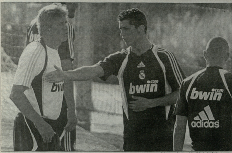
ნამდვილ რანდომის რამდენიმე მაგის შერევილობა