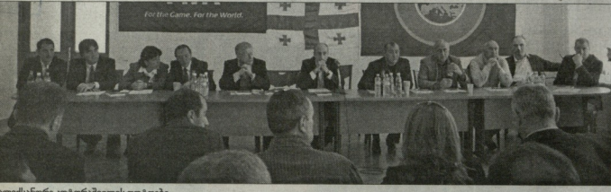
ალექსანდრე კობერავილის ფოტოები

2006 ტექნიკურ ცენტრ „ბასანი“ ფეხბურთის ფედერაციის როგორც კრებულმა და პრეზიდენტის ვადამდებ არჩევნებში გაიმართა. ყოვლობამ ორ საათზე მეტხანს გასტანა. დღის წესრიგში სულ ორი საკითხი იყო - 1. ფეხბურთის ფედერაციის პრეზიდენტის ვადამდებ არჩევნები 2. სხვადასხვა. ყოვლობის ფეხბურთის ფედერაციის ვიდეო-პრეზენტაცია ვიდეო-კონფერენცია გუთმდა. ფედერაციის სტრუქტურა - მატის ფეხბურთის ფედერაციის პრეზიდენტი ვოლგუ მისულუნი და თეოდოროს თეოდორიძის სამხრეთიდან. ხმის დამოუკიდებლობის აფხაზეთის ფეხბურთის რეგონული ფედერაციის პრეზიდენტმა მურად ანჯაფარიძემ უბედურებას მოგვსენებათ, პრეზიდენტობის მხოლოდ ერთადერთი კანდიდატი იყო - ზვიად სიხინავას კონკურენტი არ ჰყავდა. გამარჯვებისთვის (საჭირო იყო 16 ხმა (50% +1) 31 სუბიექტი-