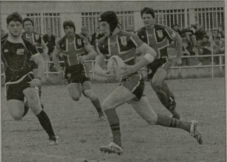
რამიონათი სპარტოვოს რამიონათი