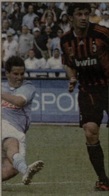
ვოლ მილანის კარში კალაძემ მხოლოდ თვითი გააყვალა

მილანური საფრთხე: კალაძე, შენაძლე, ფიგა დაპარგოს, ინგერმა სკუდარო