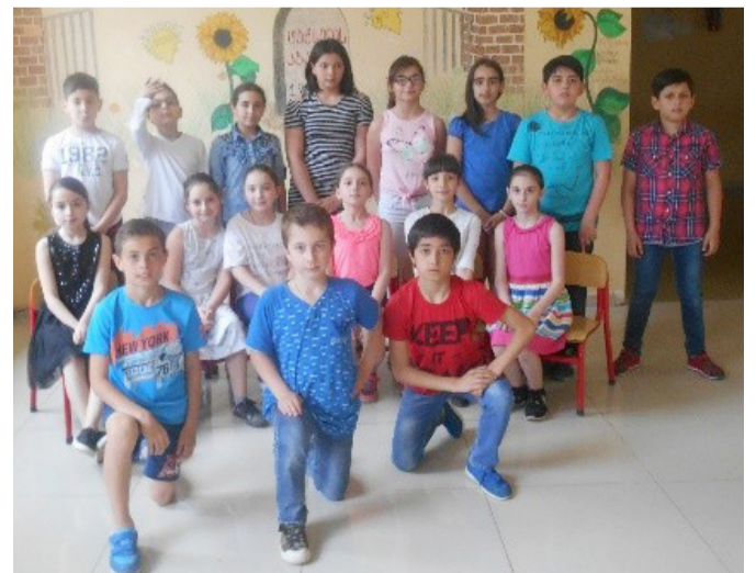
გაგრძელება მე-2 გვ.