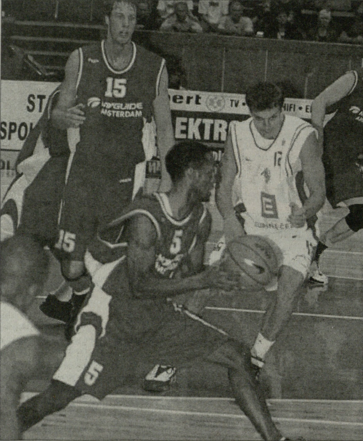
ანსტერდამი-ნიმბურკი. 5-ტიმდი გიბსონი

ერთ თვეში, 30 ოქტომბერს რუსთავის "აზოტი-ენერჯი ინვესტი" ევროტასეზზე ჰოლანდიის "ანსტერდამს" უმასპინძლებს. მატჩი თბილისის სპორტის სასახლეში 19 საათზე დაიწყება. 6 ნოემბერს ეს გუნდები ჰოლანდიის დედაქალაქში გაარკვევენ მომდევნო ეტაპზე გამსვლელის ვინაობას. აქვე იმასაც მოგახსენებთ, რომ "აზოტი"-ანსტერდამის წყვილში გამარჯვებულს მეორე საკვალიფიკაციო ეტაპზე ბელგიური "მინსი" ელის, რის შემდეგაც ევროტასეზზე დარჩენილი 16 გუნდი 4 ჯგუფად გაიყოფა და ბრძოლას ისე განაგრძობს.