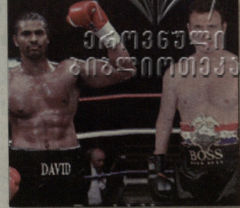
ვალიდმერ კლიარკოს მომავალ ორთაბრძოლაში სუბერმინი ნონამი IBF-სა (კრივის საერთაშორისო ფედერაცია) და WBO-ის (სსოფლის საკრივო ორგანიზაცია) ვერსიებში საჩემბიონო ქმნიერებას დაეცე მოწყეს.

ჰარიზელ ვალიდმერ კლიარკოს და ბრეტანელ დევიდ პეის პრიზადა, რომელიც 2009 წლის 20 ივნისს ლონდონში უნდა გამართულიყო, გერმანიის დედაქალაქ ბერლინში გადაიტანეს. პრიზის თარიღი უცვლელი დარჩა, - ნერს გახეიო "სანი". ბრეტანელი მძიმეინფორმის ინჟინერტი წარმომადგენლის სიტყვებით, უკარონელ და ბრეტანელ მხარეებს შორის მილაპარაკებები "98 პროცენტით დასრულდა".