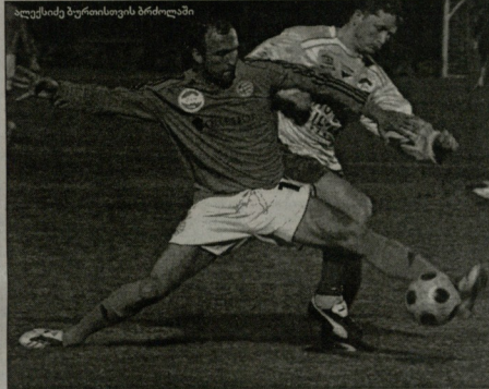
ალტესტე მურთისთვის ბრძოლაში