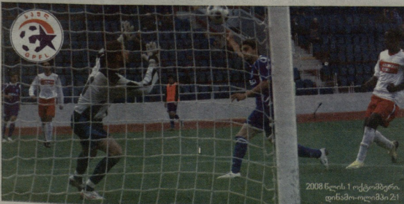
2008 წლის 1 ოქტომბერი, დინამო-ოლიმპი 2:1

რუსთაველი დიდი რაგბი ბრუნდება სარეზი უმაღლეს ლიგაში