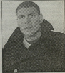
მილია კობის შეუღლა, თუმცა ამხე ვერ არ მიღება ვადაწყვეტილება.

კლუბთან კონტრაქტი ამ სეზონის ბოლოს ვიბრძობა? - კი, მაგრამ ზღუდურებას ქულით მატქს, 2010 წლისმდე, ამ ნახვებსაც შე-