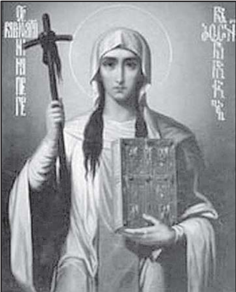
27 იანვარს საქართველოს მართლმადიდებელი სამოციქულო ეკლესიის დღესასწაულს ქალწულ ნინოს ხსენება...