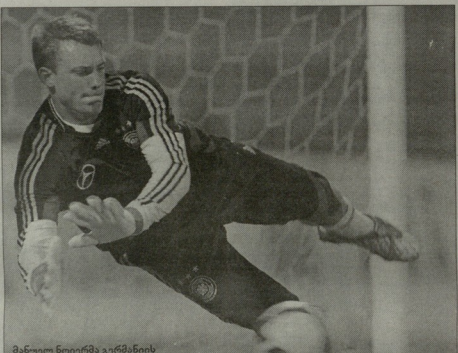
მანუელ ნოიერი „ბაიერნის“ ნაკრების თამაში