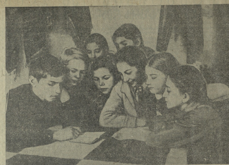
თბილისი, 80 დეკემბერი. 10 იანვარამდე გენიალურ ბოეტს მემორიალური კომპლექსის მშენებლობის დასრულება...