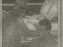
საქართველოს მედიკალიზაციაში მუშაობის მსურველებს...