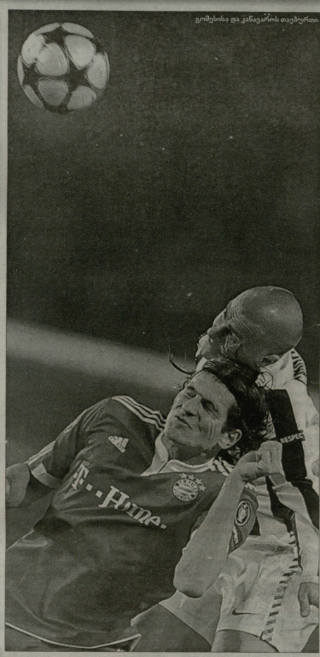
გოლის დასრულებით აღიარებული