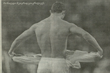
რონალდო მუკარაფი გააქრებულა