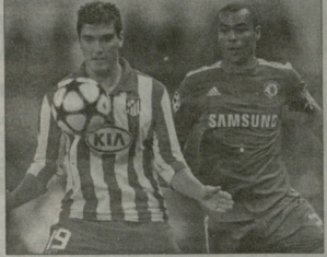
რეინი ფილანდიაში გააფორმდა