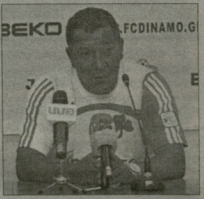
ტენიანი ხახამარა დატოვდა