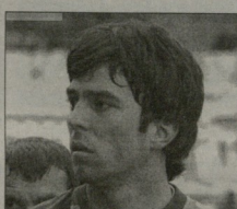
საიანდ განძა ის ინფორმაცია?