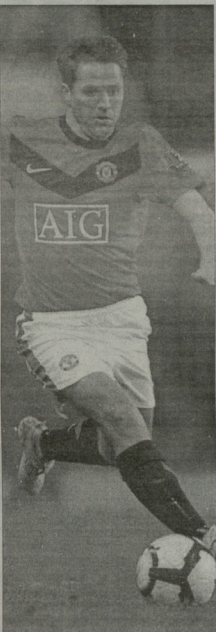
იბამბენს მაიკლ რუენი მუნდილზე?

ინგლისის ნაკრების მწერიწინაა ფაბიო კაპელიტი გამოცემა იციონა, რაცთმ არ ათამაშებს მანჩესტერ უნიტედში თაკაცის, სერ ლეეს ვერტო-სონი მიაკლ უფრანსისტამს. კაპელის თქმით, იგი რუენს აცვირდება და მხოლოდის ჩემპიონატის შესაძლო მონაწილედც მიაჩნია, მაგრამ ფორადისთვის სასიხარულო გადაწყვეტილების მიღებას ხელს უშლის ის, რომ მის სასურათ კლუბში რეკლამურულად არ ათამაშებენ.