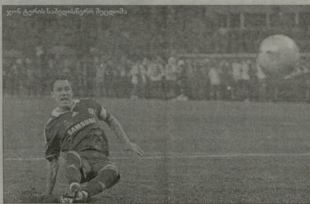
ერი დროს ასე იყო...

ბრანტმა აბრამოვიჩის ძველი აბაზაში გაუსანდა