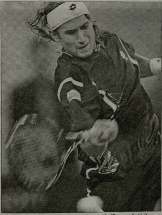
ფერერმა ფაგორიტს მოუგო