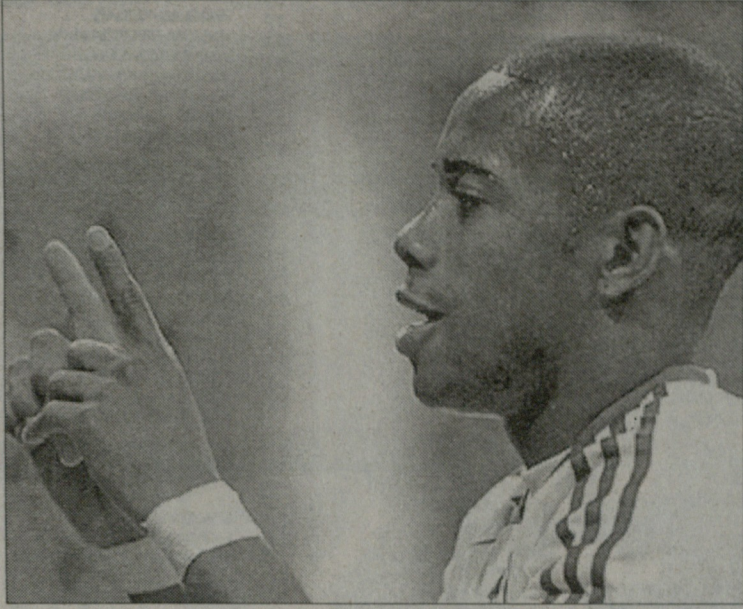
რობინიო საუკუესო იყო

"ხეტაფეს" კი სრული უფლება აქვს წარმატებით გაიხაროს. მადრიდელეებმა ორივე გოლი სტუმარი მცველების მიუტევებელი შეცდომების წყალობით გაიტანეს. ორივე შემთხვევაში დაჯიჯის ცენტრალური ნახი გაირიჟა და მანუ დელ მორალსა და შეცვლაზე შესულ ალბინს გოლებს გატანა ოდნავადაც არ გასჭირვებიათ. ბუნებრივია, შეხვედრამ მთავარ მწვრთნელებს აბსოლუტურად განსხვავებული განწყობა შეუქმნა. იმ, რა განაცხადს დაუდრეკებდა: "ბარსელონის" დამარცხება ყველასთვის საამაყოა. ბედნიერი ვარ, რომ სამწვრთნელო კარიერაში ამ უდიდეს წარმატებას მივაღწიო. ვფიქრობ, სამ ქულას დამსახურებულად მიუყვარეთ თავი. ბიჭები ვაჟაკურად იბრძოდნენ და უძლიერეს მეტოქეს ტოლს არ უდებდნენ. განსაკუთრებით პირველ ტაიმში ვიყოჩაღეთ. ფანტასტიკურად ვასპარებოდით. ახლა ისლად დავკარგინა, უდიდესი გამარჯვებით გულშემატკივრებთან ერთად გა-