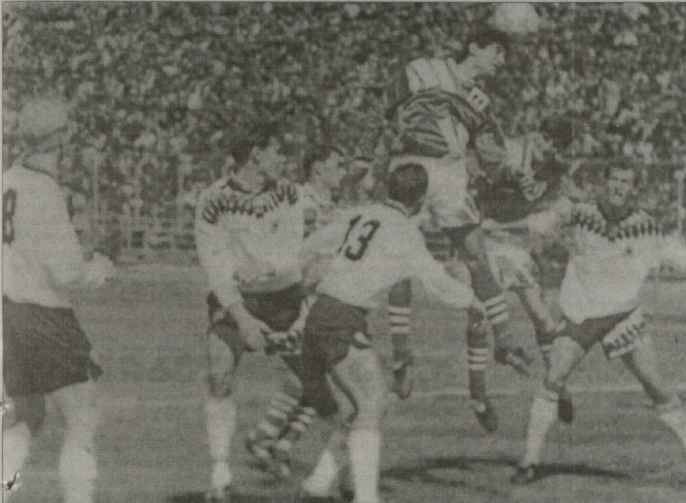
1995 წლის 28 მარტი, რუსთავი, საქართველო-გერმანია (ახალგაზრდი ნაკრებები)

„...მაა, ხისკაცებიან“ ფოლადს“ სტადიონზე 10 000 კაცი შეკრულა; თუმცა, 1995 წლის 28 მარტს რუსთავის უბანში საფეხბურთო არენაზე სულ მთავრად 5 000 კაცი მიეკრებოდა. ვასაკოვი არც იყო - როცა ილიკოვმა გერმანული სატრენინგო სპეციალისტის ვაგნერის ხელშეწყობით, 1993 წელს თბილისის საფეხბურთო კლუბის ხელმძღვანელის რამონ ვაგნერის ხელმძღვანელობით დაიწყო მუშაობა. ვაგნერის მიერ შემუშავებული სისტემა იყო სრულიად ახალი, მაგრამ იმდენად ეფექტური, რომ მალევე დამკვიდრდა საქართველოს საფეხბურთო კლუბებისთვის. ვაგნერის მიერ შემუშავებული სისტემა იყო სრულიად ახალი, მაგრამ იმდენად ეფექტური, რომ მალევე დამკვიდრდა საქართველოს საფეხბურთო კლუბებისთვის.