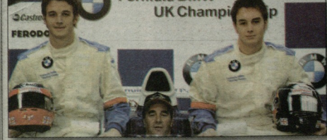
ლუი, ნაიჯელი და გრევი

ლანკასაშრული პრიტანელი ავტომობილი ნაიჯელ მენსელი მოლაპარაკებებს ანარმობებს საბოლოო სერია ALMS-ის ორგანიზატორებთან. ფორმულა 1-ში 1992 წლის ჩემპიონს Petit Le Mans-ის (პატარა ლე მანი) რბოლაში თავის ორ ვაჟთან - გრეტთან და ლუისთან ერთად სურს მონაწილეობის მიღება. ცოტა წინს ნინაჟე, პორტუგალიური მტორილის ტრასაზე, 54 წლის პრიტანელმა Lola-AER-ის ბოლიდით ოფიციალური ტესტებში მიიღო მონაწილეობა, სიადე მეორე დრო აჩვენა და მიიღო თავის მერლს, ლუის ჩამორჩა.