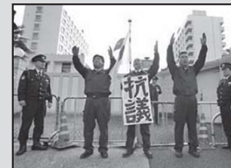
ტოკიოში რუსეთის საელჩოში გამომავალი კონფლიქტის დასრულების მოთხოვნით და მოთხოვნებით

მასწავლებელი მიმადგინებელი ქალაქში, კერძოდ, ეწერა: „ჩრდილოეთის ტერიტორიები – ეს ჩვენი მიწაა“.