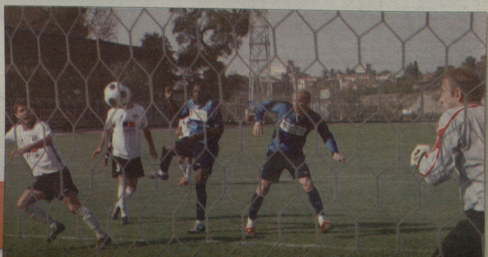
გუმინ რუსთავში, ოლიმპიკ-ტ ვიოლია 0:0