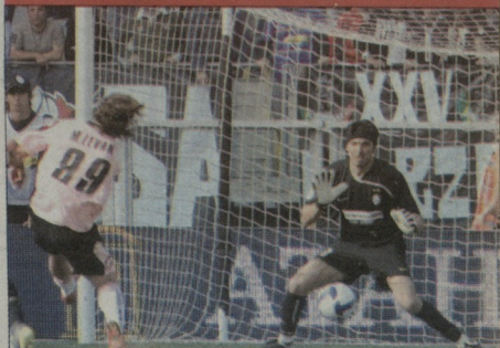
81-ეწუთი, გოლი ბუფონის კარში