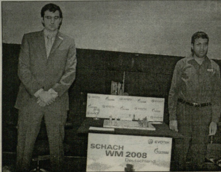
SCHACH WM 2008 Deutschland