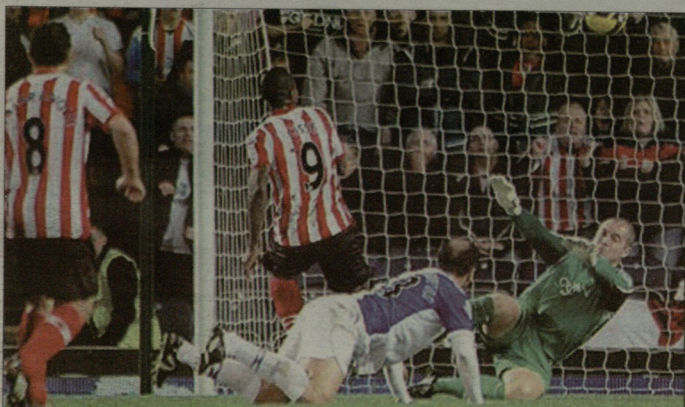
ვიღარღლ სისას გიღის ეპიზოდში სიზანიშვიღმა ბღღეღერენს ვერაღერი ოღღელა