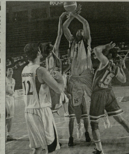
პარტიკლო საქართველოში V ტური რუსთავი