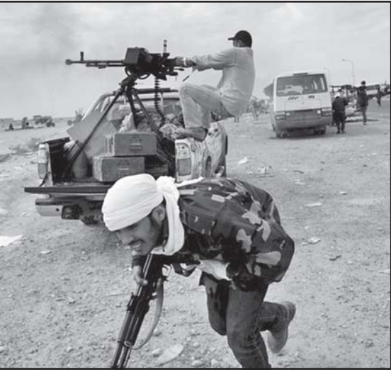
თანმიმდევრულად — ხან ერთმანეთს ეგვიპტეში...