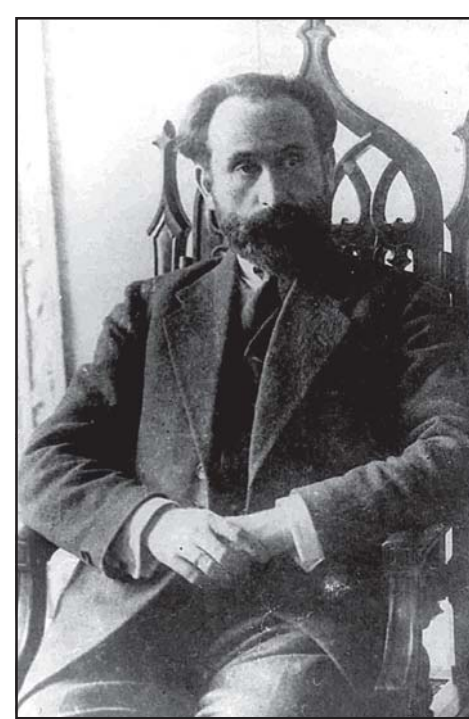
მთელი შინაგანდროშობით იმყოფებოდა ბ. ჯავახიშვილი.