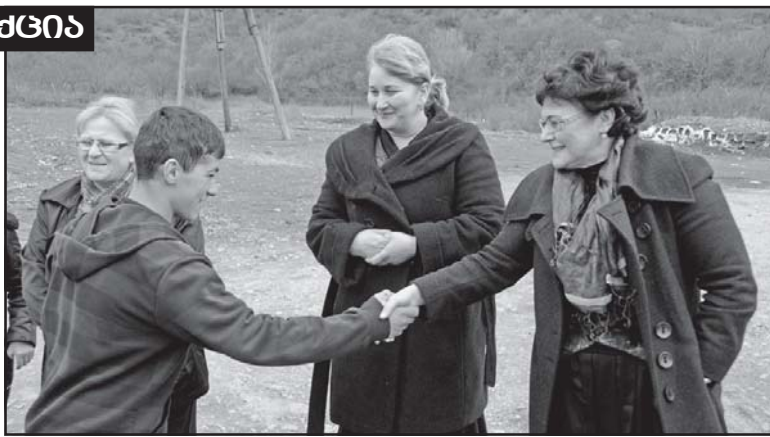
ასეთი ლაგაზი დღე გვაქვს.