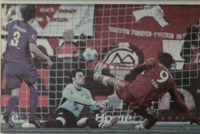
ლუკა ტონის გადაცემის შემდეგ გოლი მოქმედების კარი