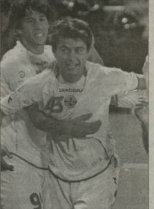
სანაზა, ოსების მხარდამჭერი დიდი ბანკების გარეშე