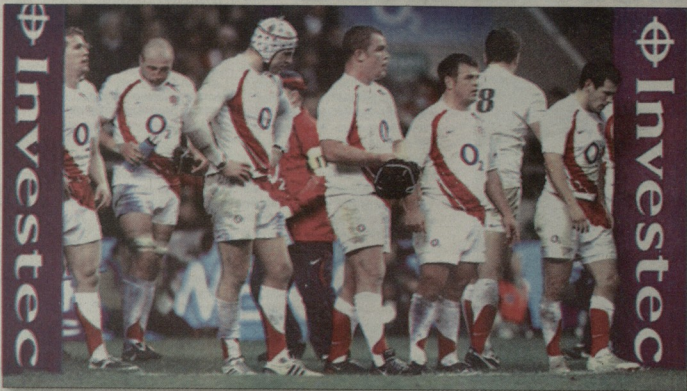
დარტმაშაიენენს, მაგარამ სამარტხინებში არავარა, როცა დიად ვუნდობს ავბი შეხედვარს".

ახალმა ზელანდიამ თეიმების მინდორზე გათვალა ინგლისის ნაკრების ნითელი ვარდა, როგორც კი სტუდენტებმა საკუთარი ტიტული იმოყეს, რისი სელისის ჩამტეხულიც დენ კარტერი გახდებდა, ინგლისელი ნესტეს თამაში უმძლავრესი