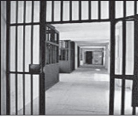
მსჯავრდებული ქალი გაათავისუფლეს... 8 ქალბატონი ნაფიქრად გათავისუფლდა, ხოლო ოთხი სასჯელი გაუხანძრდა, ამიტომაც დავა არ არის სრულყოფილი ინფორმაცია.