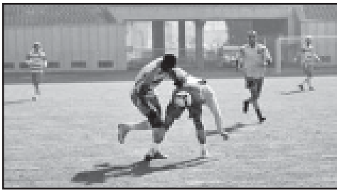
თბილისის „დინამოს“ და „მთიანეთის“ მატჩის ფრაგმენტი.