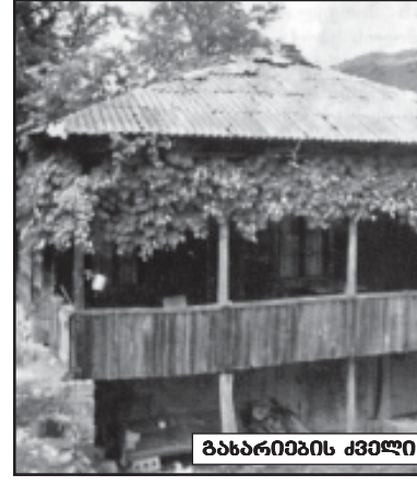
ბახარის მხარეში მდებარე სოფელი