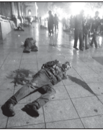
რამდენადაც მასხროს, „სახელმწიფო“ რეგულაციის საზომად უნდა იქნას, რომელიც უცხადებს, რომ ხელისუფლებას თბილისში უნდა გაეკეთებინათ სახელმწიფო რეგულაციის საზომად უნდა იქნას...