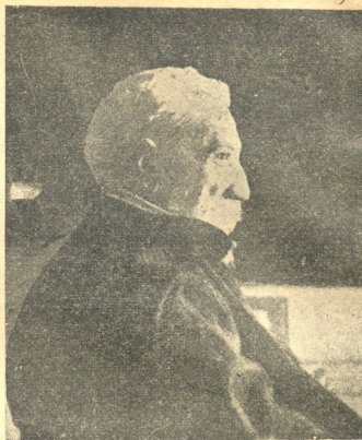
ანატოლ ფრანსი. უკანასკნელი პორტრეტი.

მაგრამ დაიწყა მეოცე საუკუნე და ფრანსიც იცვლებოდა. ორი ათეული წლებში შემდეგ, როდესაც ნაციონალიზტებმა, ანტიესემიტებმა და კატოლიკებმა მოინდომეს შიგნიდან აფეთქებინათ საფრანგეთის ბურჟუაზიული რესპუბლიკა; მაშინ მთელი საფრანგეთი გაიყო ორ ბანაკად, საფრანგეთის სოციალისტური პარტია ე. უორისის ხელმძღვანელობით ჩაგდა ერთიან რესპუბლიკანურ ფრონტის სათავეში. აქ ფრანსში მოხდა კარდინალური გარდატეხა. ბუნებით მგრძნობიარე, ჭეშმანიური, უღირსათ ინტერნაციონალისტის და ანტი რელიგიოზური