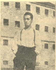
ტოლლერ საპარტიო ბიუროში.

ამ მიმართულების წარმომადგენლები დრამის სფე-