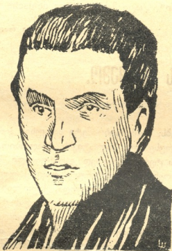
ტ ო ლ ლ ე რ .