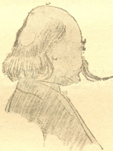
დ. არაკიშვილი შარი სიღამონ-ერისთავისა