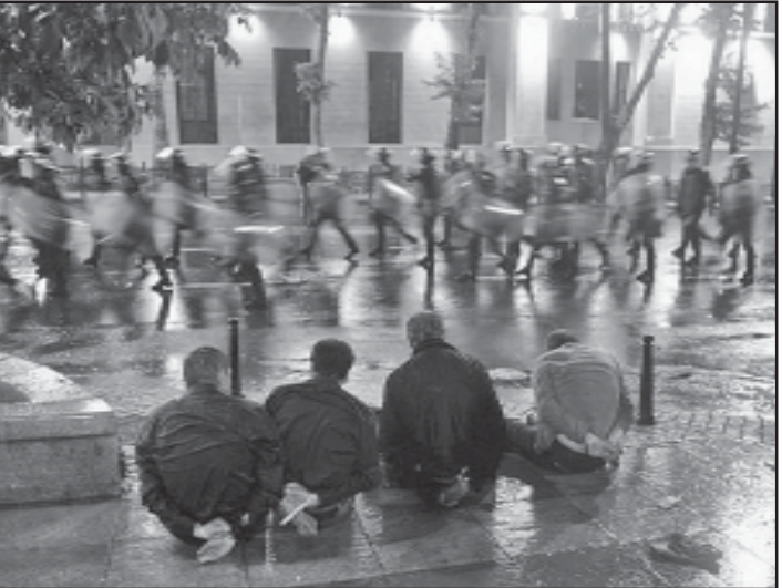
კომუნიკაციების დასაცავი სამსახურის მომსახურეები