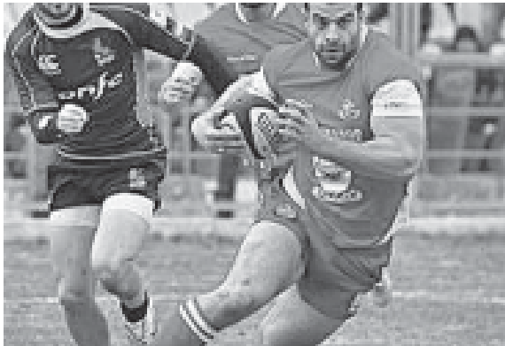
ნათი — სამხრეთ აფრიკა კინგზი, უორტუბალია — ნამიბია. 19 ივნისი, უორტუბალია — სამხრეთ აფრიკა კინ- გზი, სახარტველო — ნამიბია, რუმინეთი — არგენტინა A.